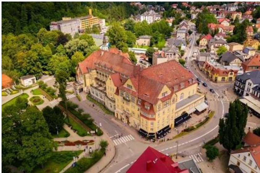
Fot. nr 1 . Obecny wygląd budynku Szpitala Uzdrowiskowego "Polonia". Widok od strony Parku Zdrojowego i ul. Zdrojowej w Kudowie-Zdroju.